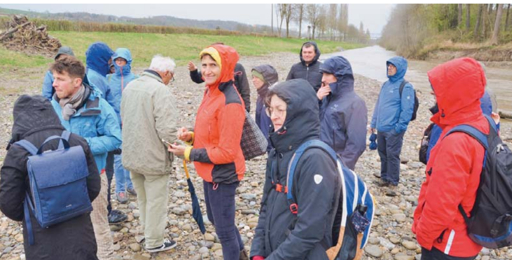
Sur les berges de la Broye.

Avant d'aborder l'exemple de la Commune de Surpierre, nous avons eu l'occasion d'écouter d'autres personnes impliquées sur les