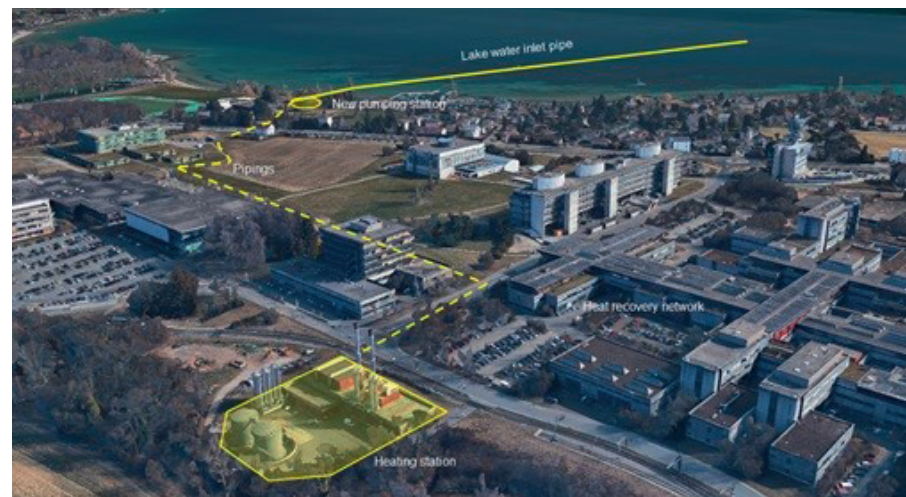
Centrale de chauffage et de refroidissement du campus UNIL-EPFL à partir de l'eau du lac Léman. Par la combinaison des besoins de chauffage et de refroidissement et la gestion de bassins tampons d'eau froide et d'eau réchauffée, ce projet permet d'augmenter considérablement l'efficacité globale du système